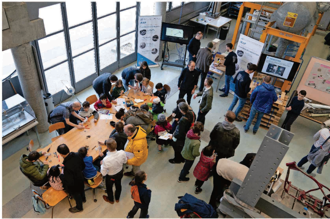
Für Gross und Klein gab es spannende Angebote.

Ein Blick zurück: - Vor 30 Jahren (1992) wurden die tschechischen Tennisspielerinnen Karolina und Kristyna Pliskova geboren. Karolina, die rechtshändige, ist erfolgreicher: Sie war im Juli 2017 Weltranglisten-Erste. - Vor 60 Jahren wurde der US-Schauspieler Matthew Broderick geboren. Seine bekanntesten Rollen spielte er in «War Games» (1983) und «Ferris macht blau» (1986).