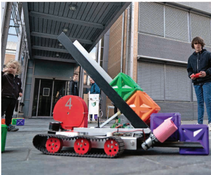
Ein Hingucker war der Roboter, den man ausprobieren durfte.