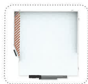
Gain de la surface utile pour l'utilisateur