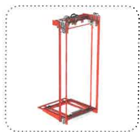
Gain de poids de l'ensemble de la structure porteuse