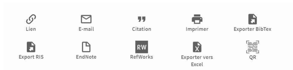
Figur 3 : Import aus Swisscovery

Sie können bibliografische Listen in Endnote erstellen, indem Sie Artikel aus Web of Science und/ oder Bücher aus Swisscovery importieren (solange ein EndNote-Tab geöffnet ist).