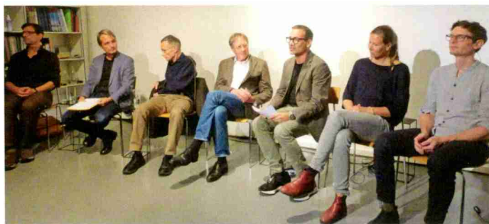
Engagierte Diskussion unter Architekten und Baufachleuten an der ersten «Denkraum»-Veranstaltung.

Mit wachsender Dringlichkeit wird die Aufrüstung von Gebäuden mit Photovoltaik-Modulen gefordert. Gerade bei bestehenden Bauten stehen die Verantwortlichen desbezüglich vor grossen kulturellen Herausforderungen. Die erste Veranstaltung der Reihe «Denkraum» setzte sich mit ihnen auseinander.